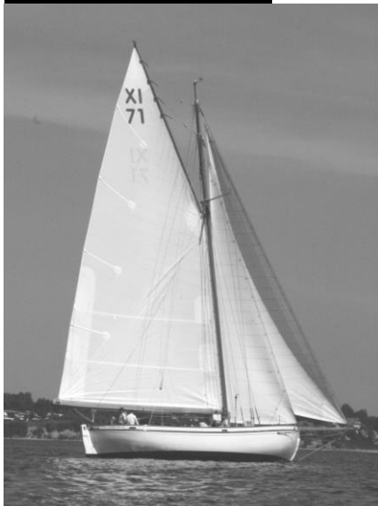
Beispiel für einen Holz-Mast,