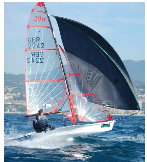
und einen CFK-Mast